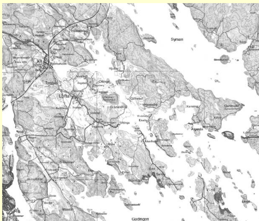
Tjusts vikar omkring år 1000

Tjust ligger i knutpunkten mellan två viktiga färdleder. Den ena är den väst-öst-liga leden från Göteborg via Skara, Vadstena, Linköping och Tjust till Gotland, Ryssland och de arabiska