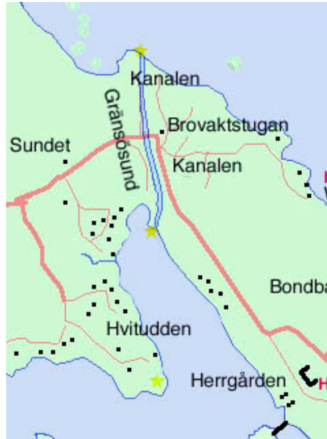
Karta från år 1995

Kanalens längd anges i en källa till 660 m och i en annan till 705 m. Avståndet 660 m kan vara avståndet mellan stränderna för 150 år sedan. Mellan fyrarna är det 695 m, kanalen svänger något varför 705 m är den riktiga längden.