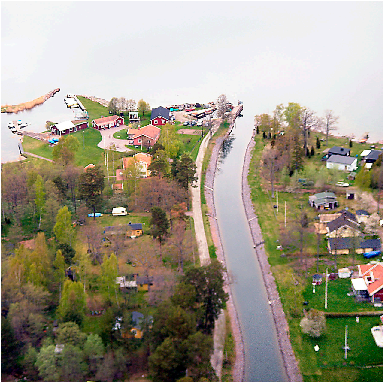
Kanalens utfart mot Gudingen.