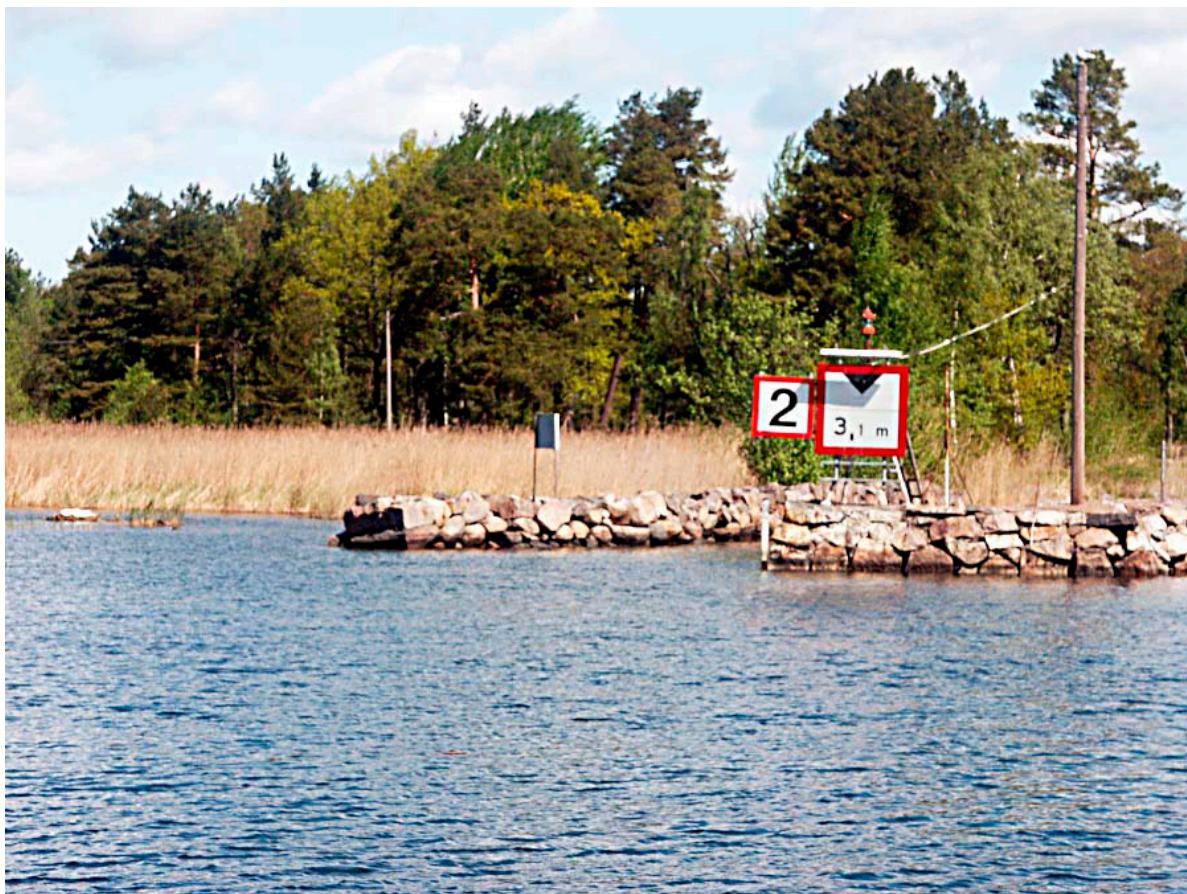
Södra infarten år 2004.

Här finns markerat två hus på 1878 års karta. Antagligen är det ena torpet Kanalen som nämns år 1838. Det andra kan vara brovaktstugan.