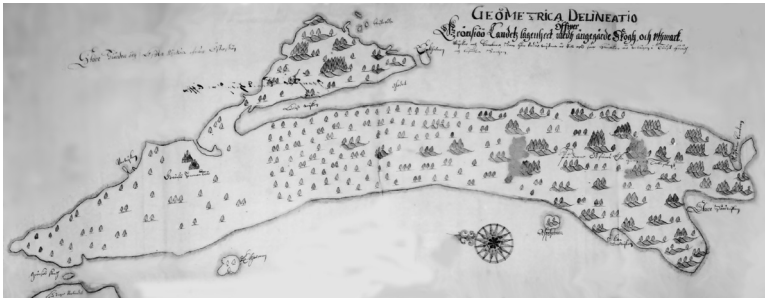
Karta år 1750 tv.

Det naturliga sundet mellan Gränsö och Norrlandet var farbart i äldre tid. Men på grund av landhöjning och igenväxtning behövdes en del uppröjningar. Det finns noteringar om sådana från åren 1697 och 1719.