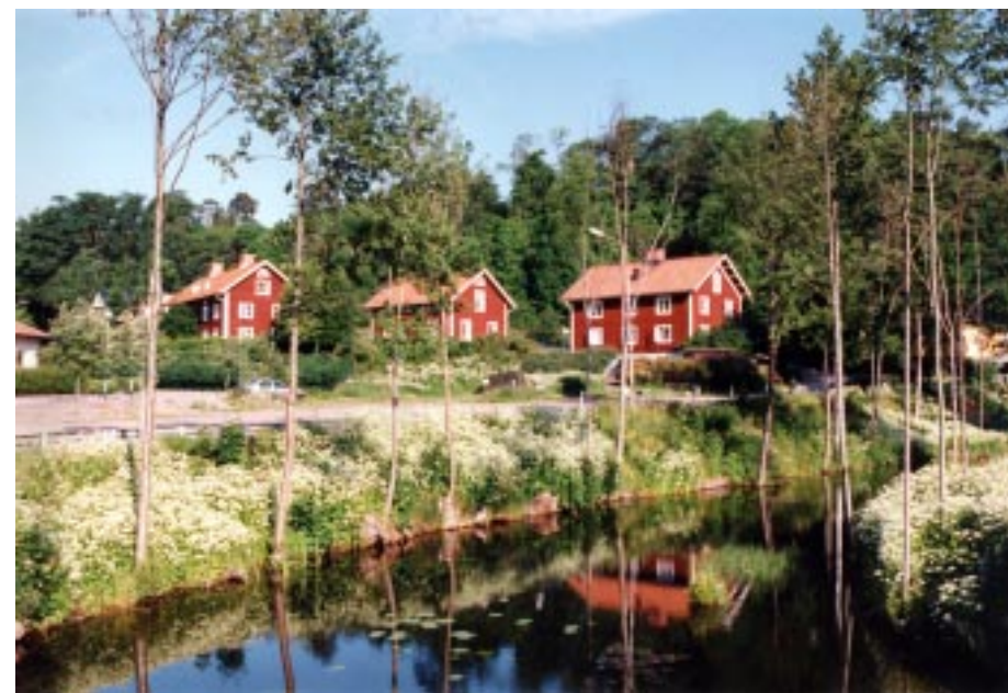
Idylliskt ligger de gamla arbetarbostäderna som nu förvandlats till vandrarhemmet Åtta Små Hem och Kafé Källarbacken

Öppet: 15/6 - 15/8 2001 dagligen 16-17 utom lördagar och midsommar.