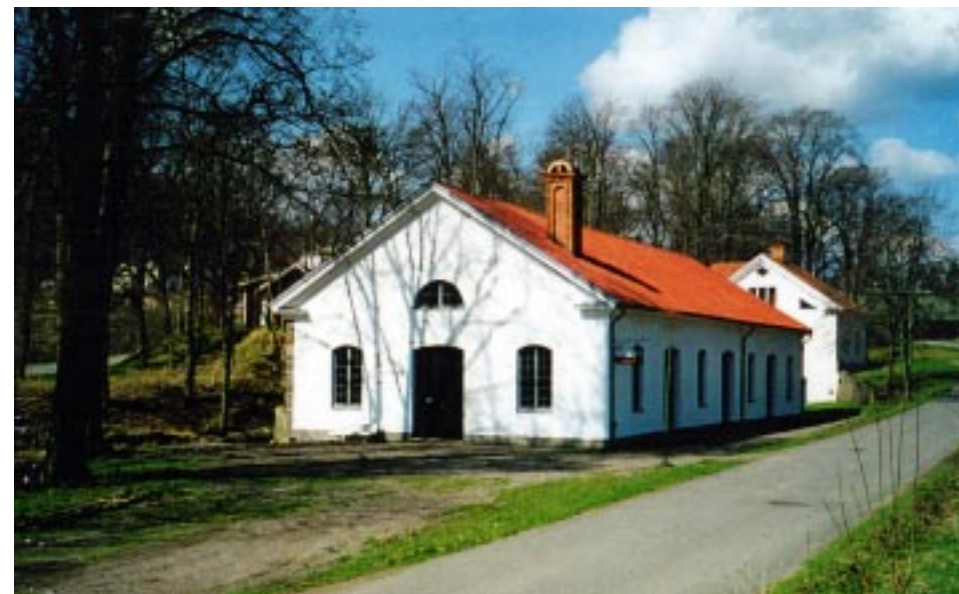
Den gamla hammarsmedjan