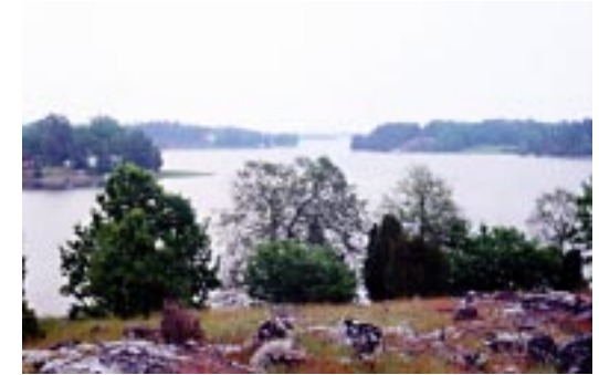
Utrikeviken invid loftaleden