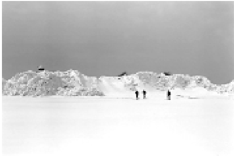
Sladö Ask i april 1970 Askarna skymtar bakom isbarriären.