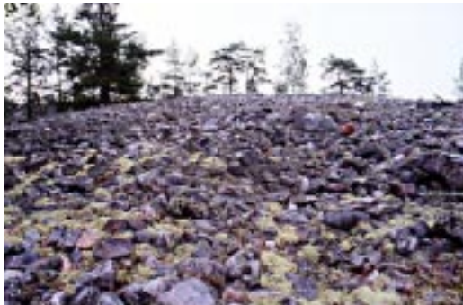
Inlandsisens verk, stentorg vid Stångerör i Lofta