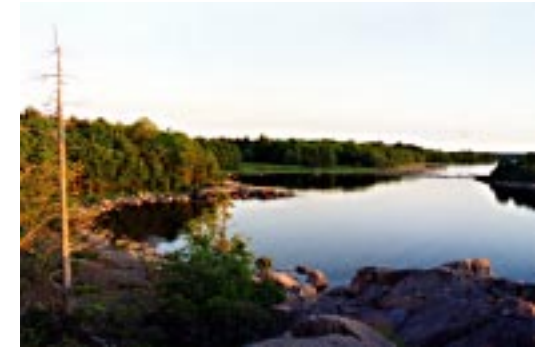
Natthamn i Sladö

Tjust Norra skärgård erbjuder fyra mil underbar natur med tusen öar. I norr finns Valdemarsviken och socknarna Tryserum och Östra Ed med stora naturreservat. Vid Hallmare möts fastland och hav för att straxt skiljas av de djupa vikarna Gudingen och Syrsan. Gränsö är ön som är gräns mellan södra och norra Tjust. Ord kan inte beskriva skärgården. Vi låter därför bilderna tala.