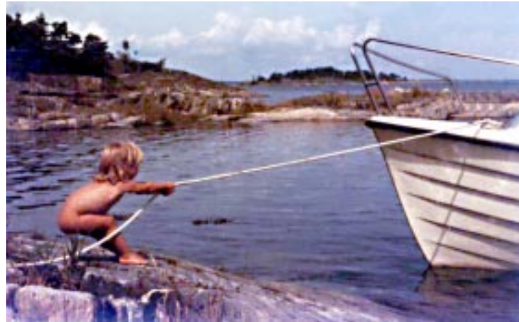
Skärgården erbjuder många naturhamnar

Tjust Norra skärgård erbjuder fyra mil underbar natur med tusen öar. I norr finns Valdemarsviken och socknarna Tryserum och Östra Ed med stora naturreservat. Vid Hallmare möts fastland och hav för att straxt skiljas av de djupa vikarna Gudingen och Syrsan. Gränsö är ön som är gräns mellan södra och norra Tjust. Ord kan inte beskriva skärgården. Vi låter därför bilderna tala.