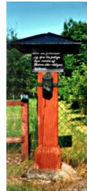
Fattigbössan vid Söderköpingsvägen genom i Vida by.