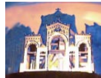
Lofas kyrkorgel, en Marcussen & Son, ger konsertupplevelser i sommarnatten.