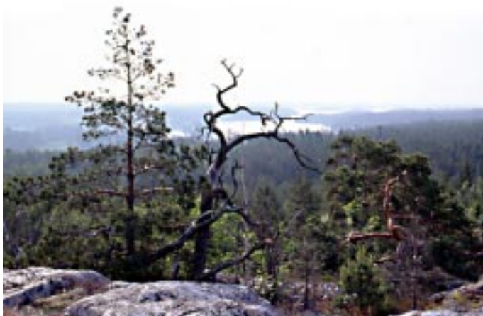
Stångerör vid Loftaleden med Gudingen i bakgrunden

Gudingebadet hette förr Vinö Stock och lämpar sig för familjeschamping.