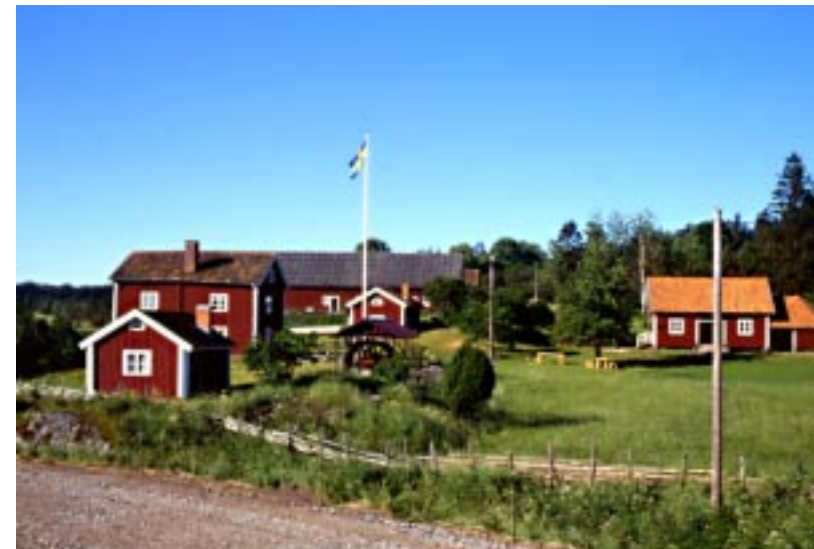
Lofa hembygdsgård i Råberga