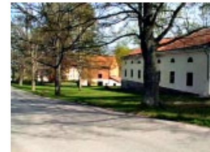
Infarten till bruksområdet