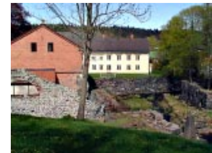
Hammarsmedjan vid gamla åfåran och herrgården i bakgrunden

Straxt söder därom ligger Västra Eds Hembygdsgård som en gång varit prästgård men flyttats flera gånger. Där finns nu ett intressant bygdemuseum. Ytterligare ett litet stycke mot E22 ligger kyrkan och ruinen av det gamla medeltida templet som är ett av de äldsta i Tjustbygden och omnämnt på 1100-