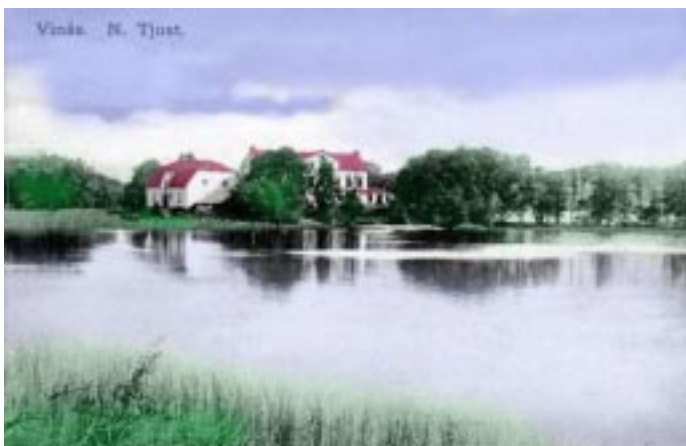
Vinäs i Storsjön vid 1900-talets början