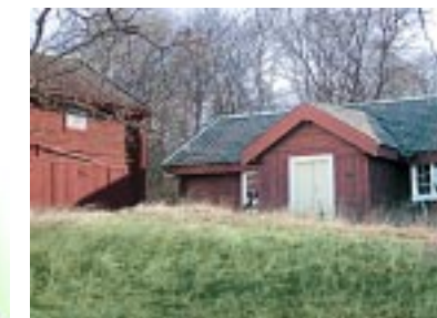
Ravenäs vid E22 är Kulturmärkt