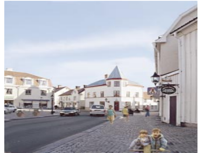
Gamleby torg - Tjustbygdens 'centralort' under ett millenium.

Traditionen bibehålls nu av familjen Egil Bergström med skutvarvet vid Kasimirsborg.