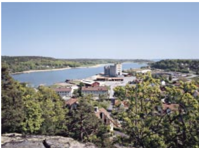
Garpedansberget är 77 m högt och bjuder på fantastiska vyer och fina promenadslingsor.